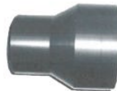
Reducție din PEİD

Fitingurile injectate sunt utilizate în instalații cu presiuni de max. 40 bar (funcție de SDR și materia primă utilizată la fabricare).