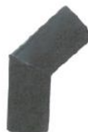
Cot din segmente sudate din PEİD

Fitingurile din segmente de țevă sudate sunt utilizate în instalații cu presiuni de maxim 100% din valoarea presiunii de utilizare a țevilor din care au fost realizate (valoarea presiunii variază în funcție de tipul fittingului realizat, de domeniu de utilizare, de materie primă și de SDR).