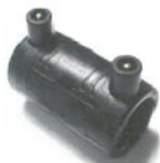
Mufă pentru electrofuziune

Electrofitingurile sunt utilizate în instalații cu presiunea de 16 bar pentru SDR11, respectiv 10 bar pentru SDR17.