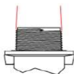
ISO 7/1 Conical