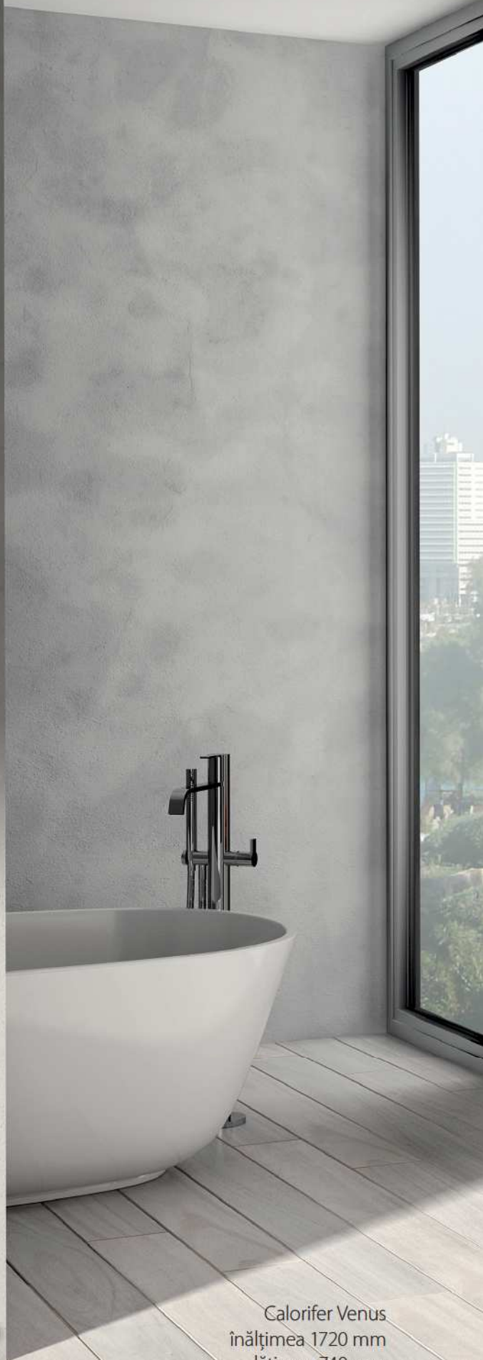
Calorifer Venus înălțimea 1720 mm lățimea 740 mm puterea termică 1451 Watt finisaj Alb Standard (cod. 01)